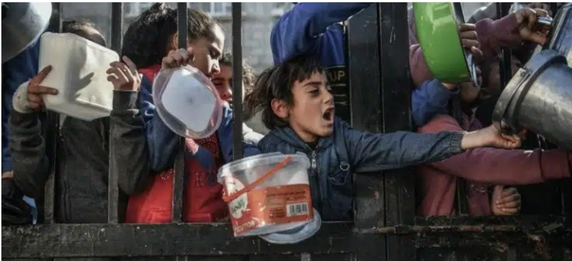
Bambini che aspettano di ricevere cibo nella città di Rafah, nel sud di Gaza.

«Al Consiglio di sicurezza viene riportata la carestia a Gaza come “quasi inevitabile” se non si aumentano considerevolmente gli aiuti»